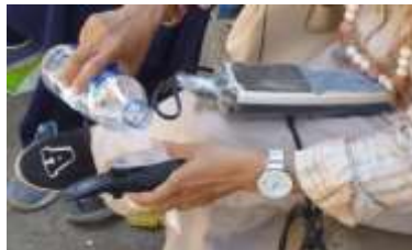
Gambar 1. peralatan yang digunakan dilapangan (insitu)

Analisis Pengukuran Parameter Kualitas Air Tanah Analisa penelitian ini meliputi dua kegiatan, yaitu analisa sample di lapangan (in situ) dan di laboratorium. • Analisa sample in situ Dilakukan untuk parameter kualitas air yang sifatnya cepat berubah. Seperi salinitas dan PH • Analisa Laboratorium Untuk mengetahui kandungan kimia dari air tanah yang tidak dapat dilakukan secara langsung ( in situ ) maka air tanah dibawa ke Badan Penelitian dan Pengembangan Industri laboratorium peguji BBIHP untuk dilakukan analisa laboratorium. Hasil uji insitu dan laboratorium bertujuan sebagai material sekunder yang akan memperkuat alasan hipotesis penggunaan air sumur sebagai air minum.