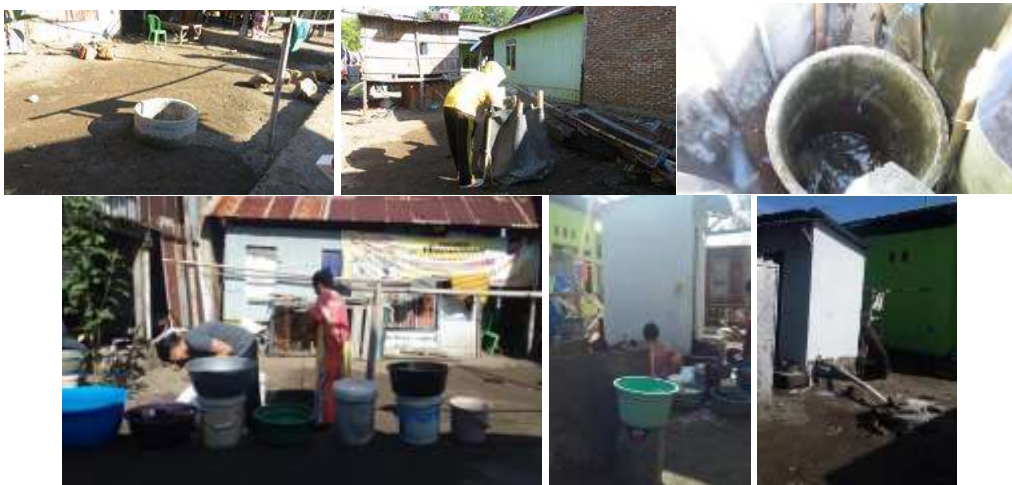
Gambar 6. Sumber air bersih untuk MCK dari sumur. MCK umum Jarak antara lubang septiktank dengan sumur adalah 4 m

Sumur-sumur diberi dinding beton dengan kedalaman hanya 2m-2,5 m. Dari aspek fisik air terlihat jernih dan tembus dari permukaan ke dasar sumur, tidak berbau, dan sebagian tawar dan sebagian lagi terasa agak asin (table 1 dan 2). Berikut gambar sumur dan pandangan dari atas