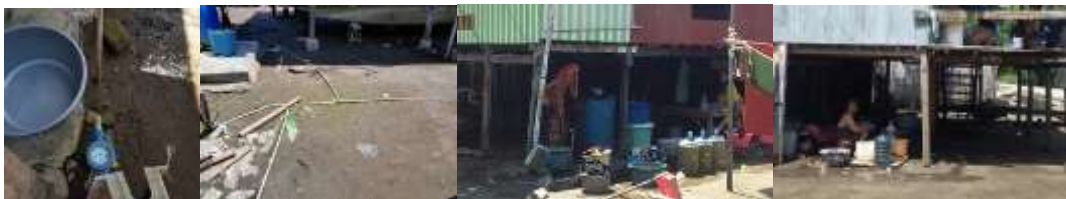
Gambar 2. Sistem penyaluran pipa air bersih dan Masyarakat yang sedang menggunakan air bersih untuk mencuci dari air PAM

Sumber air bersih didapat dari 3 sumber, 1. Untuk air bersih kebutuhan MCK pada wilayah Takalar diperoleh dari PAM yang masuk ke dalam permukiman melalui jaringan pipa, sedang untuk kebutuhan air minum dengan membeli air gallon. Untuk kebutuhan MCK masyarakat yang rumahnya berada di koa Makassar (barombong) menggunakan sumur gali dan untuk kebutuhan air minum dengan membeli air gallon.