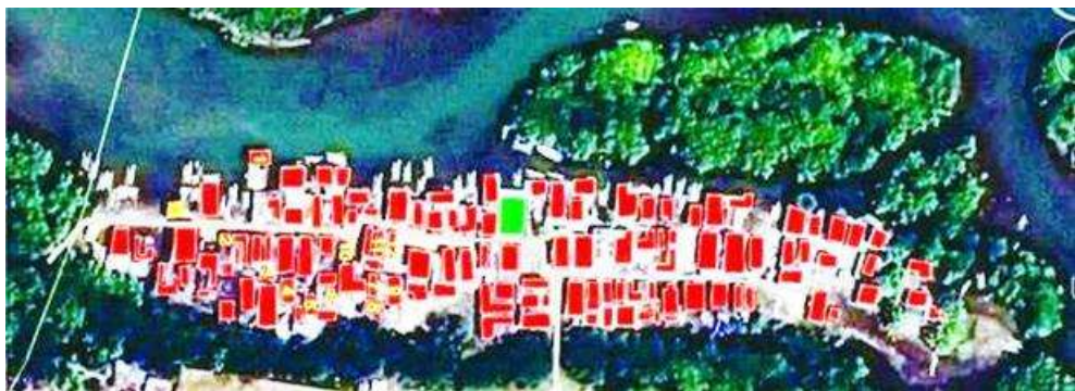
Gambar 4. Sumur dangkal sumur hanya digunakan untuk kebutuhan mencuci. Permukiman dikelilingi oleh hutan mangrove

Pengukuran yang menggunakan uji lab hanya dilakukan pada 2 sumur yang selama ini sangat sering digunakan oleh masyarakat dibanding 2 sumur lainnya, yaitu sumur no 3 dan 4. Adapun data pengukuran uji lab untuk pada ke dua sumut tersebut adalah sbb: